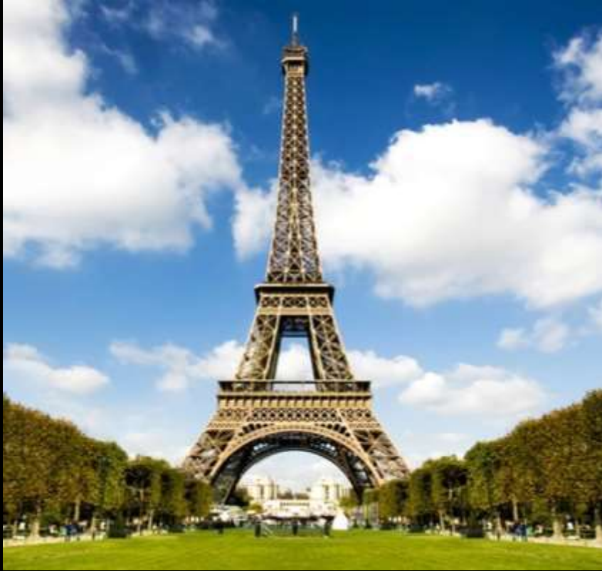
Torre Eiffel, París