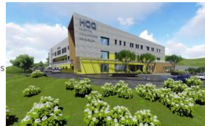
Hospital de Queilén