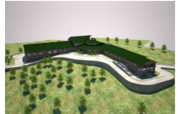
Hospital San Juan de la Costa

En este ejercicio dinámico, las comunidades han ido incorporando nuevos requerimientos y demandas de convivencia entre los dos modelos de medicina (institucional y originarias).