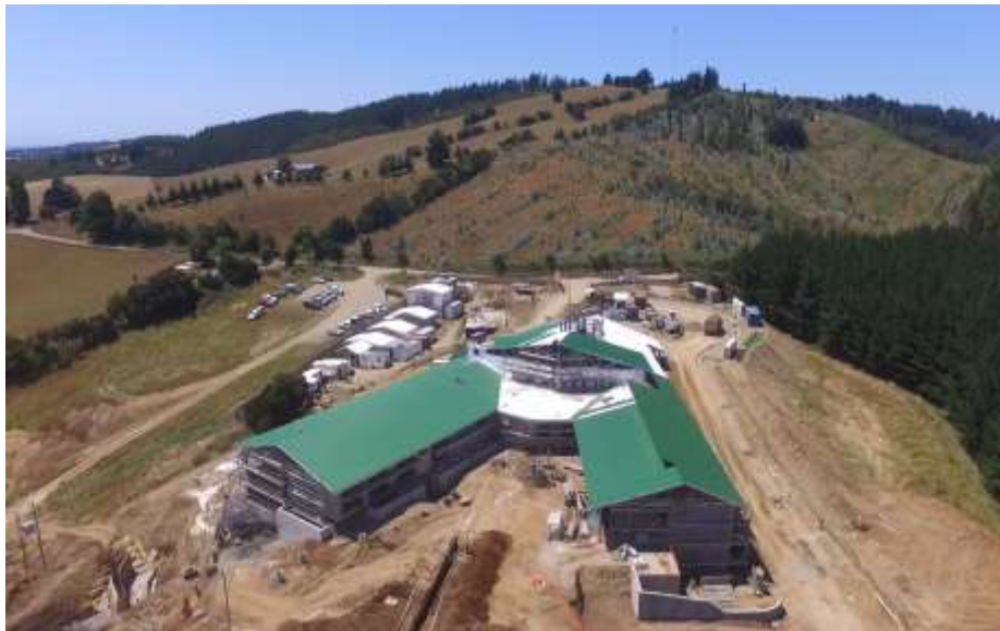
Hospital de Quilacahuín