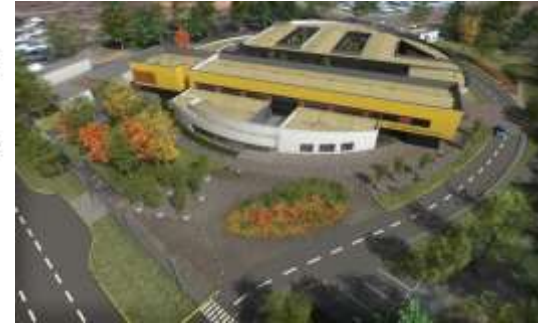
Hospital de Collipulli