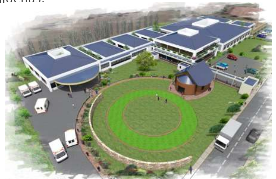
Hospital de Makewe