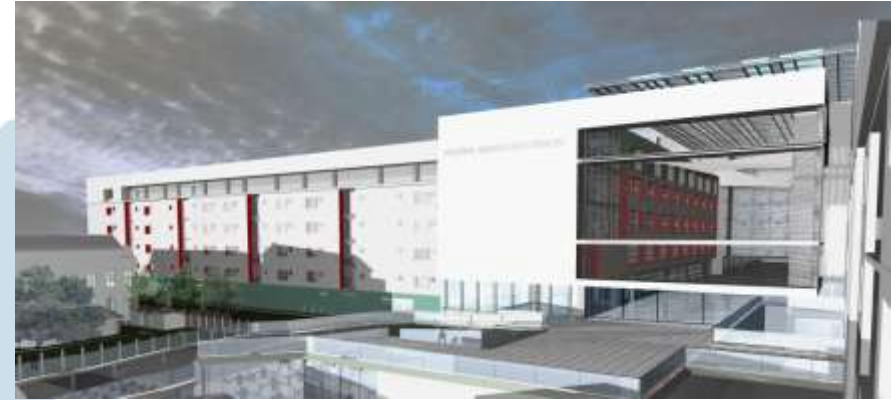
Hospital Barros Luco