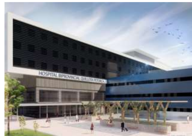
Hospital de Quillota