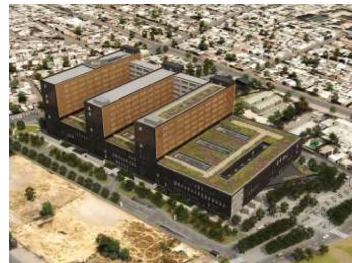
Hospital Félix Bulnes