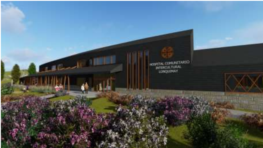
Hospital de Lonquimay