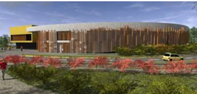
Hospital de Collipulli